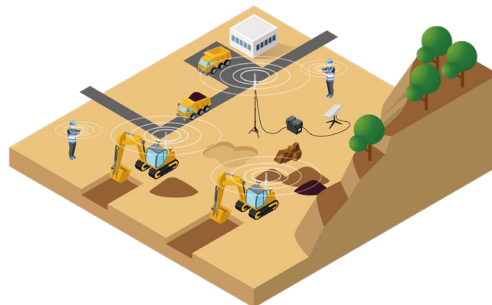
(“通信不感地対策Wi-Fiパック”を設置した現場)